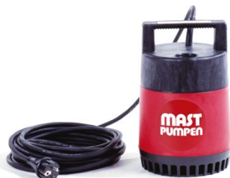
Förderhöhe H m (WS)