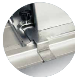
Satz mit 2 Adaptern 608275A für Kompatibilität mit allen Handkreissägen von Jepson Power