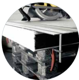
2x Klemmen für schnelles und einfaches Spannen

Optionaler Verbinder zum Verbinden mehrerer Führungsschienen verfügbar.