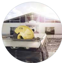
Ideale zum Ablängen von Sandwichplatten