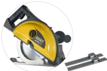
Mit Adapterset 2 Stück 608275A: Kompatibel mit ALLEN Handkreissägen von Jepson Power

Mit unserem neuen Adapterset 608275A ist unsere meistverkaufte Führungsschiene jetzt mit unserem gesamten Sortiment an handgeführten Metallkreissägen kompatibel.