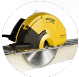
Kompatibel mit SHDC 8320 (S. 33) & SHDC 8320AIR (S. 39)