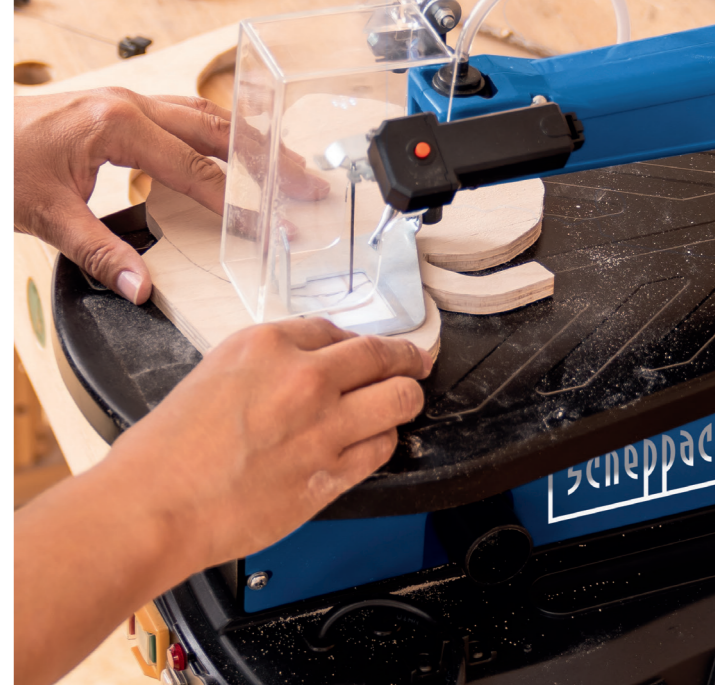
Ideal für filigrane Projekte