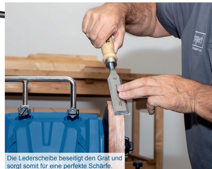
Die Lederscheibe beseitigt den Grat und sorgt somit für eine perfekte Schärfe.