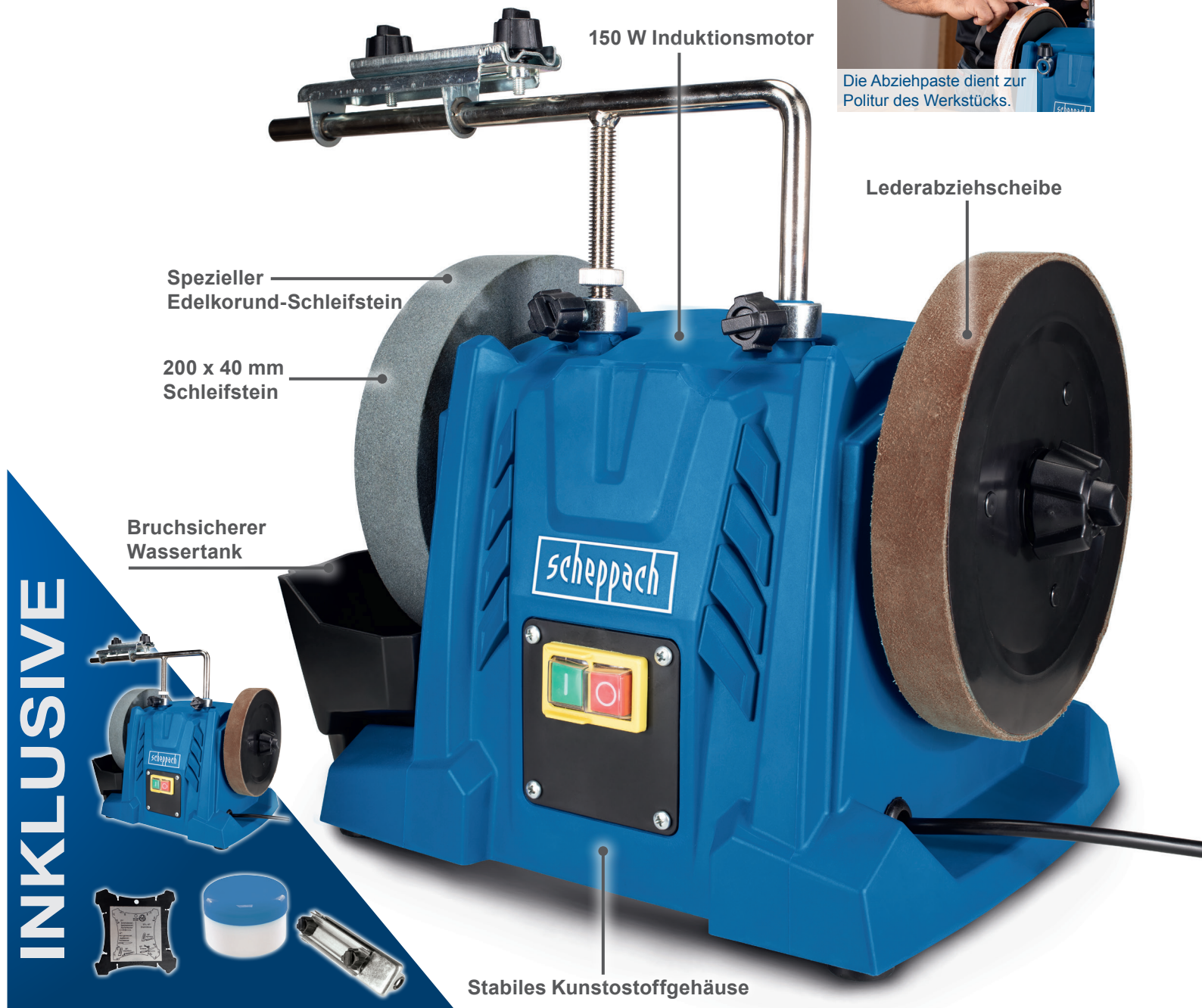
150 W Induktionsmotor