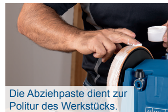
Die Abziehpaste dient zur Politur des Werkstücks.