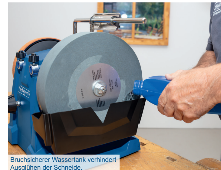
Bruchsicherer Wassertank verhindert Ausglühen der Schneide.