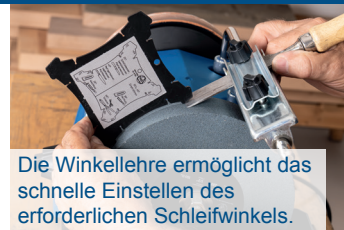
Die Winkellehre ermöglicht das schnelle Einstellen des erforderlichen Schleifwinkels.