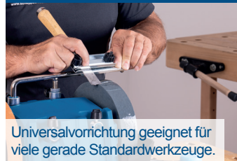
Universalvorrichtung geeignet für viele gerade Standardwerkzeuge.