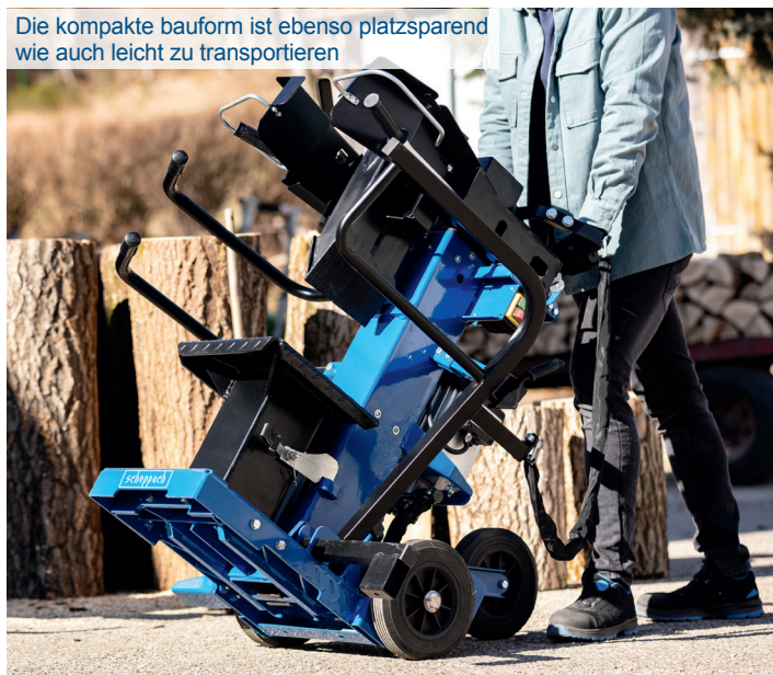
Die kompakte Bauform ist ebenso platzsparend wie auch leicht zu transportieren