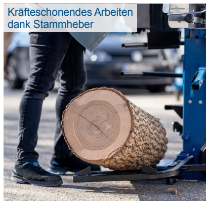
Kräftechonendes Arbeiten dank Stammheber