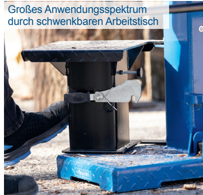
Großes Anwendungsspektrum durch schwenkbaren Arbeitstisch