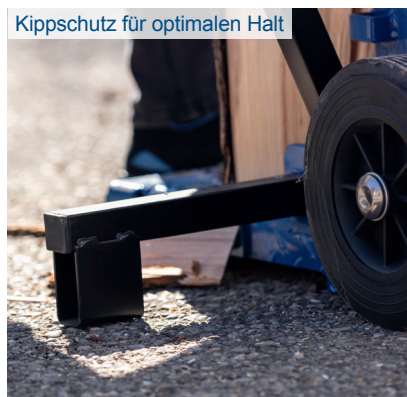
Kippschutz für optimalen Halt