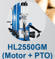
HL2550GM (Motor + PTO)