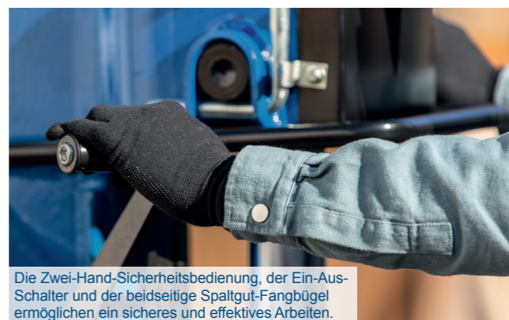
Die Zwei-Hand-Sicherheitsbedienung, der Ein-Aus-Schalter und der beidseitige Spaltgut-Fangbügel ermöglichen ein sicheres und effektives Arbeiten.