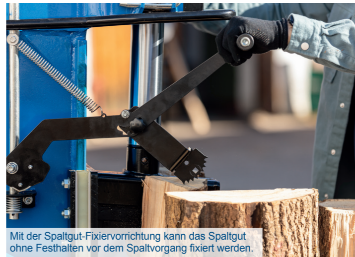
Mit der Spaltgut-Fixiervorrichtung kann das Spaltgut ohne Festhalten vor dem Spaltvorgang fixiert werden.