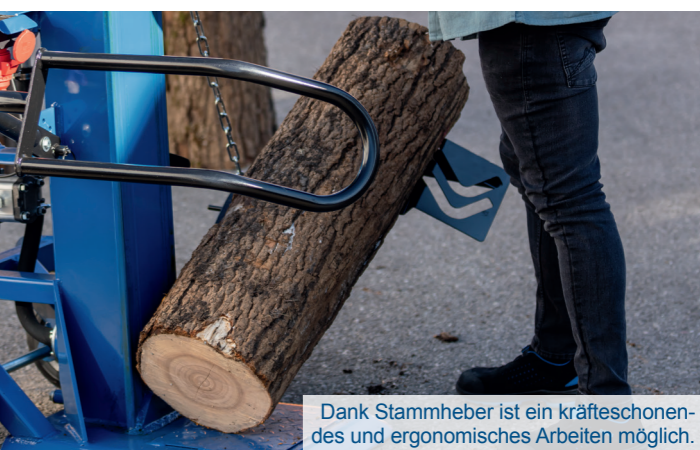
Dank Stammheber ist ein kräfteschonendes und ergonomisches Arbeiten möglich.