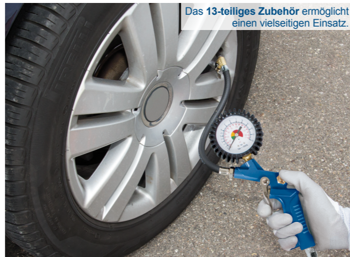
Das 13-teilige Zubehör ermöglicht einen vielseitigen Einsatz.