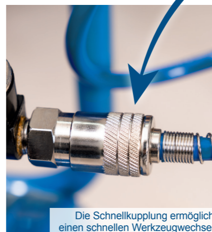
Die Schnellkupplung ermöglicht einen schnellen Werkzeugwechsel.