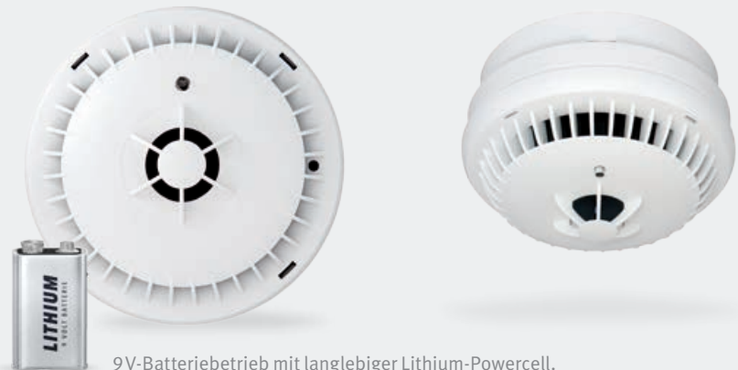
9V-Batteriebetrieb mit langlebiger Lithium-Powercell.

Ideal als Ergänzung zu Rauchwarnmeldern im Privatbereich.